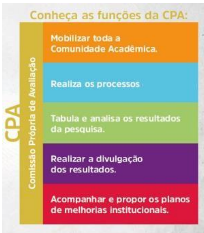
Figura 3 – Funções CPA