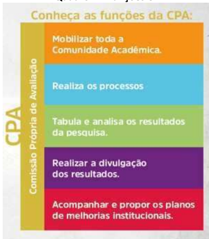
Quadro 4 – Funções CPA